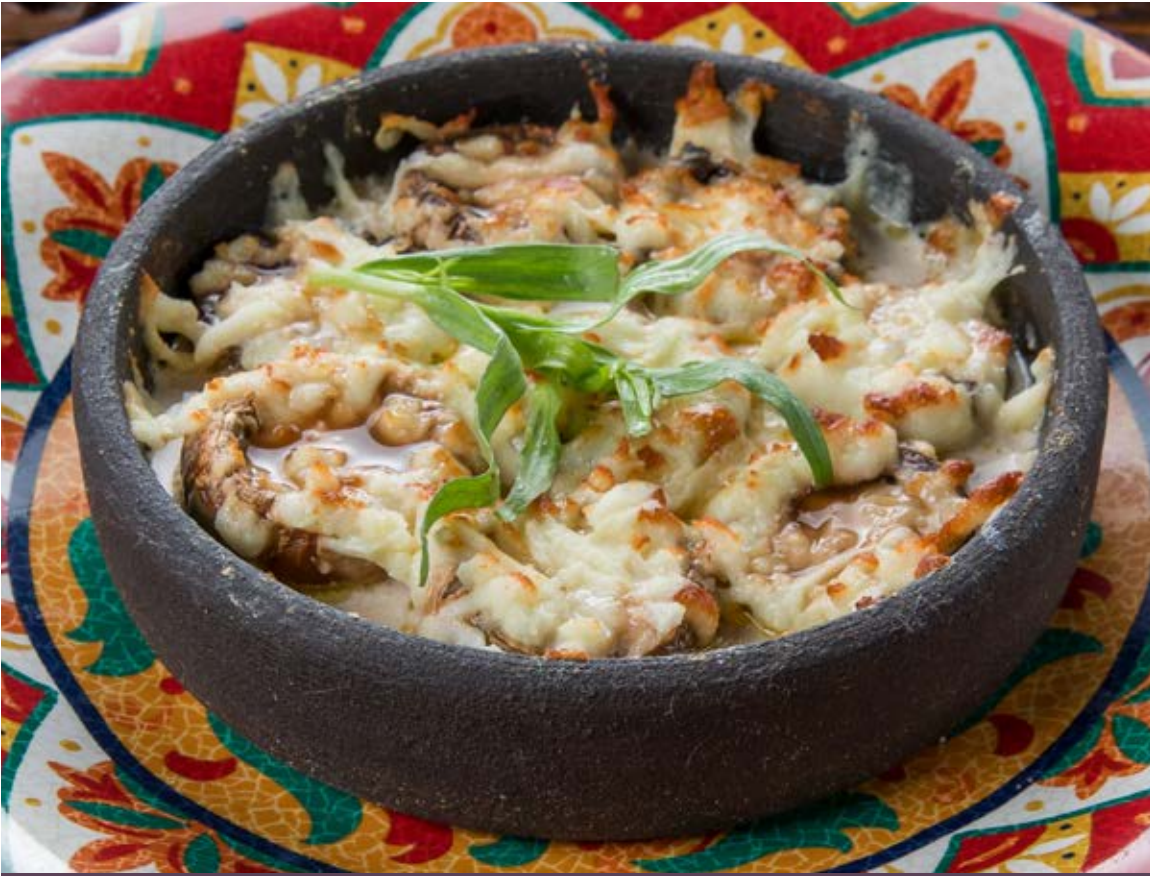
ШАМПИньОНЫ ЗАПЕЧЁННЫЕ 290 ₴ :: 250 g Baked White Mushrooms 烤白蘑菇