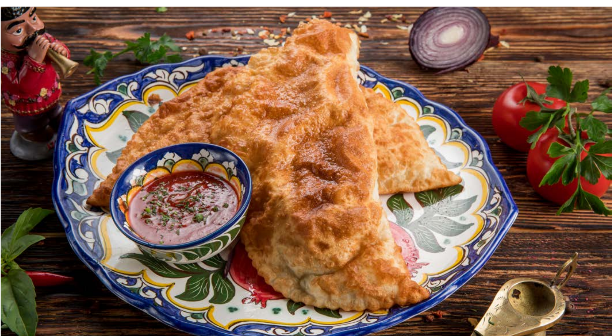
ЧЕБУРЕКИ С ГОВЯДИНОЙ (2 шт.) 290 ₴ :: 200/50 g Подаются с красным соусом Chebureki with Beef (2 Chebureki). Served with red sauce 牛肉馅饼 (2个)。搭配红酱 ЧЕБУРЕКИ С БАРАНИНОЙ (2 шт.) 310 ₴ :: 200/50 g Подаются с красным соусом Chebureki with Lamb (2 Chebureki). Served with red sauce 羊肉馅饼 (2个)。搭配红酱

ПРЕДУПРЕДИТЕ ВАШЕГО ОФИЦИАНТА, ЕСЛИ У ВАС ИМЕЕТСЯ АЛЛЕРГИЯ НА ОПРЕДЕЛЕННЫЕ ПРОДУКТЫ ПИТАНИЯ. ВСЕ ЦЕНЫ УКАЗАНЫ В РУБЛЯХ. PLEASE SPEAK TO YOUR WAITER/WAITRESS IF YOU HAVE ANY FOOD ALLERGIES OR INTOLERANCES. ALL PRICES ARE SHOWN IN ROUBLES. 如果您对某种食物过敏，请提前告知服务员。所示价格均为卢布。