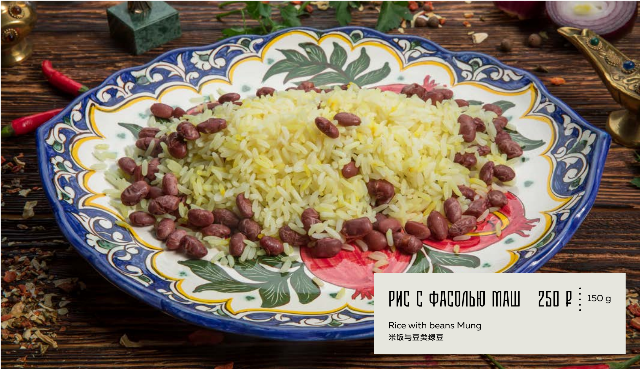
РИС С ФАСОЛЬЮ МАШ 250 р 150 g