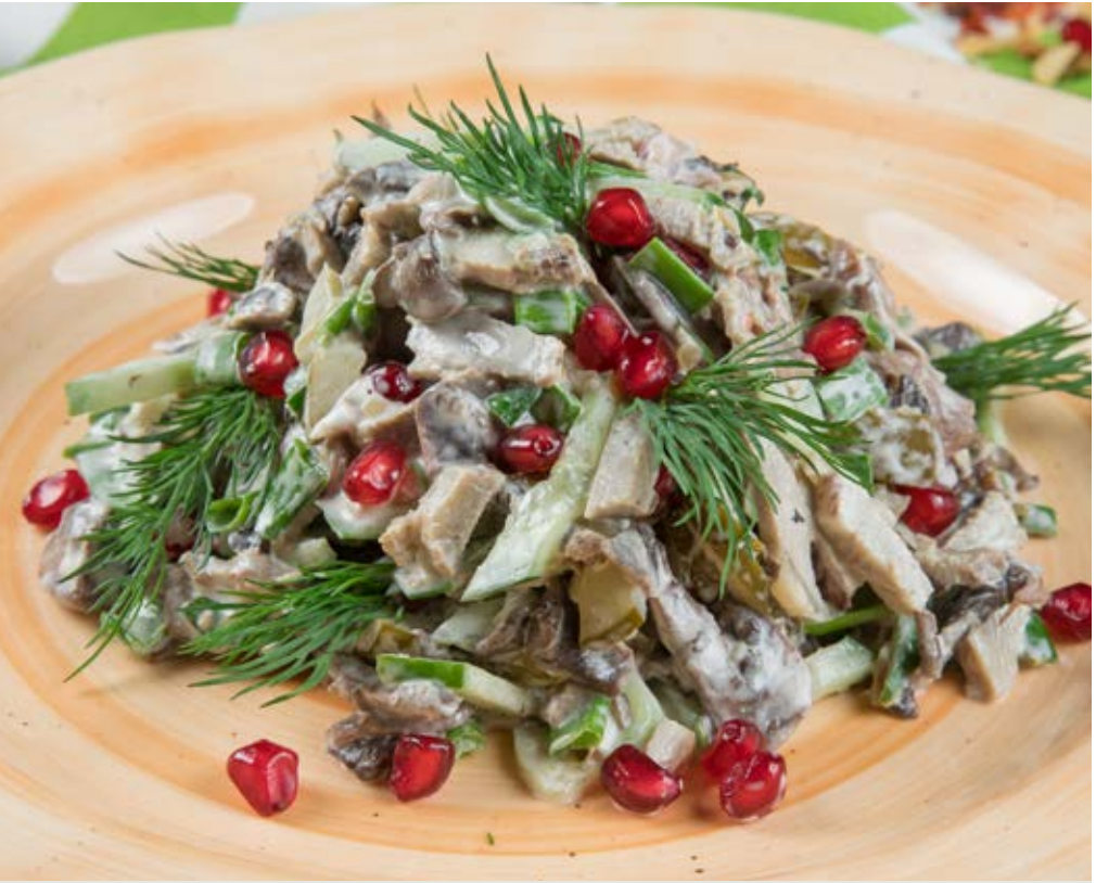
САЛАТ АПШЕРОН 430 р 200 g Нежная отварная теллятина с жареными грибами и солеными огурцами. Заправляется соусом Айоли

Avocado and Chef Smoked Salmon Salad Avocado and chef smoked salmon salad with mixed leaves and citrus dressing 牛油果微腌三文鱼沙拉 · 牛油果、微腌三文鱼、混合生菜沙拉 · 浇柑橘汁