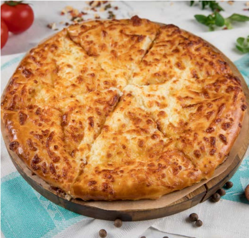
ХАЧАПУРИ ПО-МЕГРЕЛЬСКИ 420 ₴ :: 420 g Megrelian Khachapuri 明格列里亚卡查普里