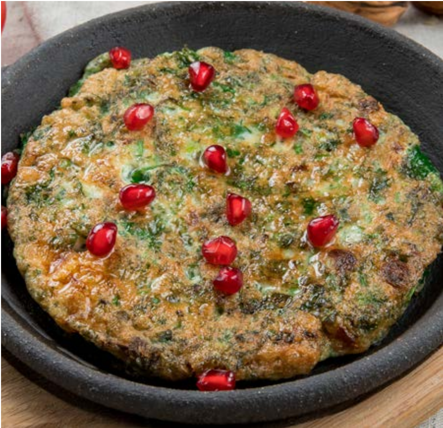
КЮКЮ С ЗЕЛЕНЬЮ 290 ₴ :: 120 g Восточный омлет с зеленью Kuku with Herbs. Middle Eastern herb baked omelette 蔬菜库库。东方蔬菜煎蛋饼