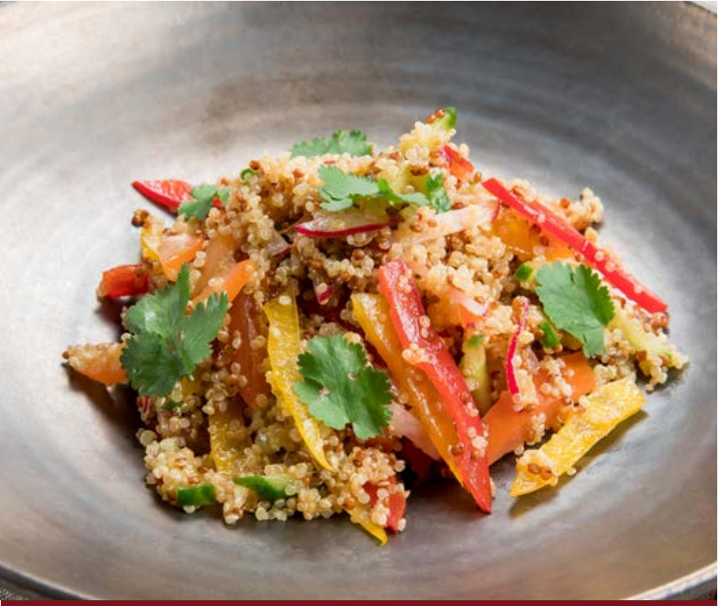
КЕНОА С ОВОЩАМИ 290 р 200 g Кеноа с овощами и пряной заправкой

BBQ Salad. Barbecued vegetables with a herb dressing 烧烤沙拉 · 辛香调料烤蔬菜萨尔萨酱