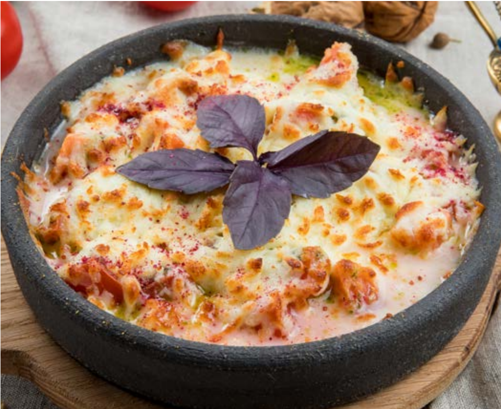
ЗАПЕЧЁННЫЕ ТОМАТЫ С СЫРОМ СУЛУГУНИ 360 ₴ :: 270 g Томаты запечённые с сыром и соусом Песто Tomatoes Baked with Suluguni Cheese Tomatoes baked with cheese and pesto sauce 苏尔古尼奶酪烤番茄。奶酪香蒜酱烤番茄