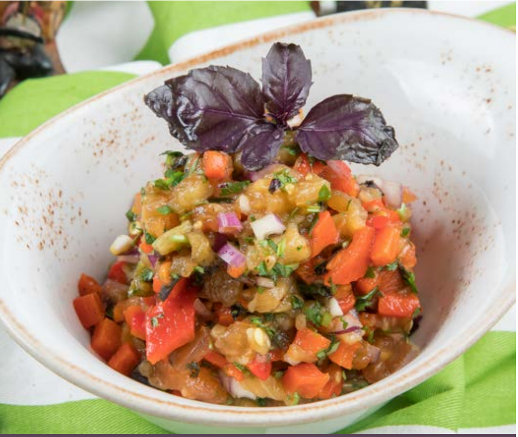
МАНГАЛ-САЛАТ 490 р 200 g Сальса из овощей, приготовленных на мангале с пряной заправкой

Pomegranate Bracelet. Tender chicken fillet, prunes, walnuts, creamy sauce with pomegranate seeds and grapes 石榴手串 · 鲜嫩的鸡胸 · 黑李 · 核桃 · 石榴籽葡萄奶油酱