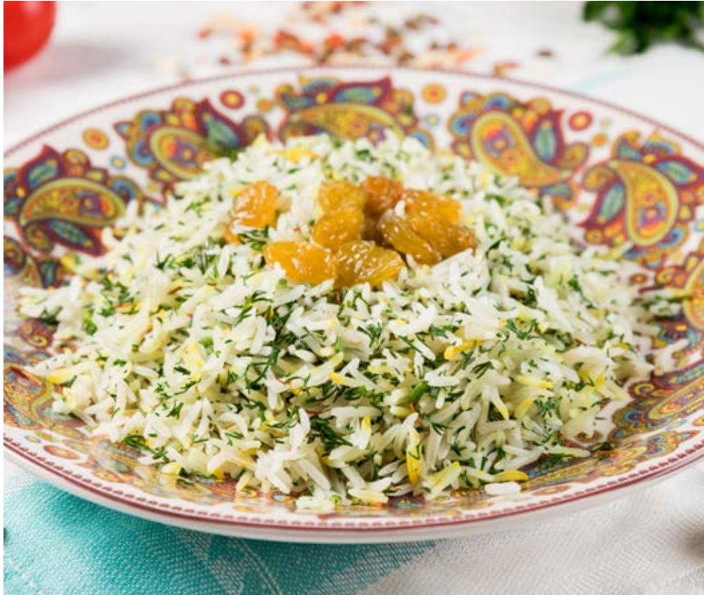
РИС С ЗЕЛЕНЬЮ