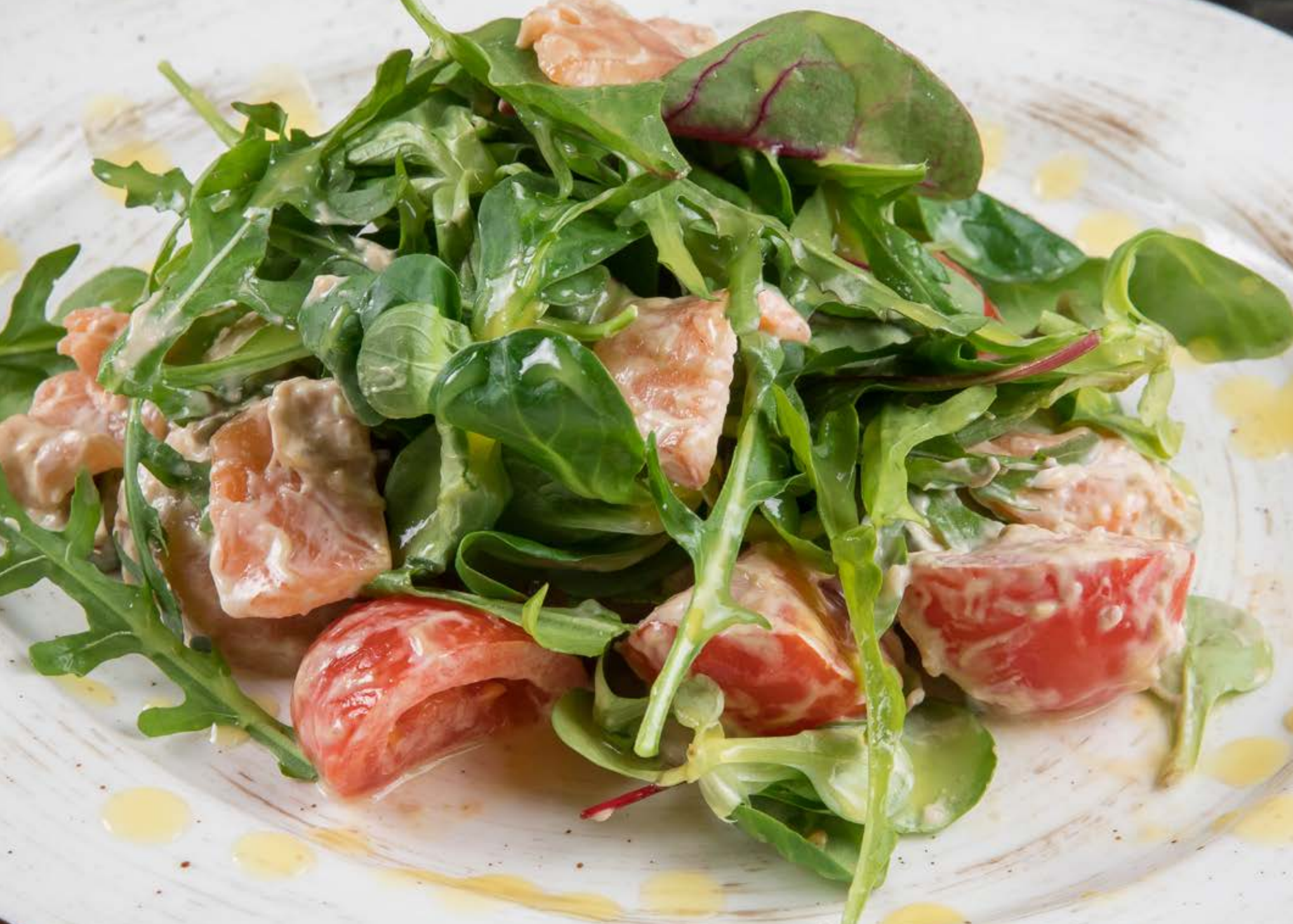
САЛАТ ИЗ АВОКАДО И ЛОСОСЯ ШЕФ-ПОСОЛА 530 р 300 g Салат из авокадо и лосося шеф-посола с миксом салата, заправленный цитрусовым соусом

Avocado and Chef Smoked Salmon Salad Avocado and chef smoked salmon salad with mixed leaves and citrus dressing 牛油果微腌三文鱼沙拉 · 牛油果、微腌三文鱼、混合生菜沙拉 · 浇柑橘汁