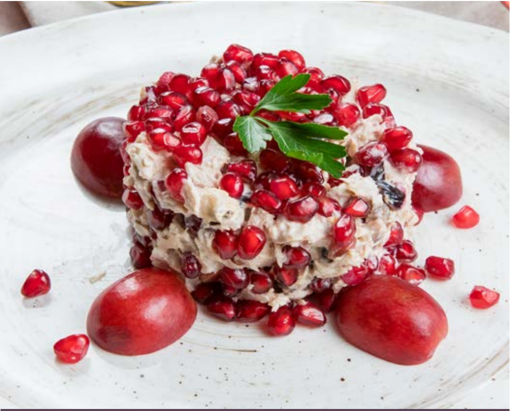
ГРАНАТОВЫЙ БРАСЛЕТ 490 р 300 g Нежное куриное филе, чернослив, грецкий орех, сливочный соус с зернами граната и виноградом

Assorted greens Green onions, parsley, cilantro, basil, dill 什锦果岭 葱 欧芹 香菜 罗勒 蒔蘿