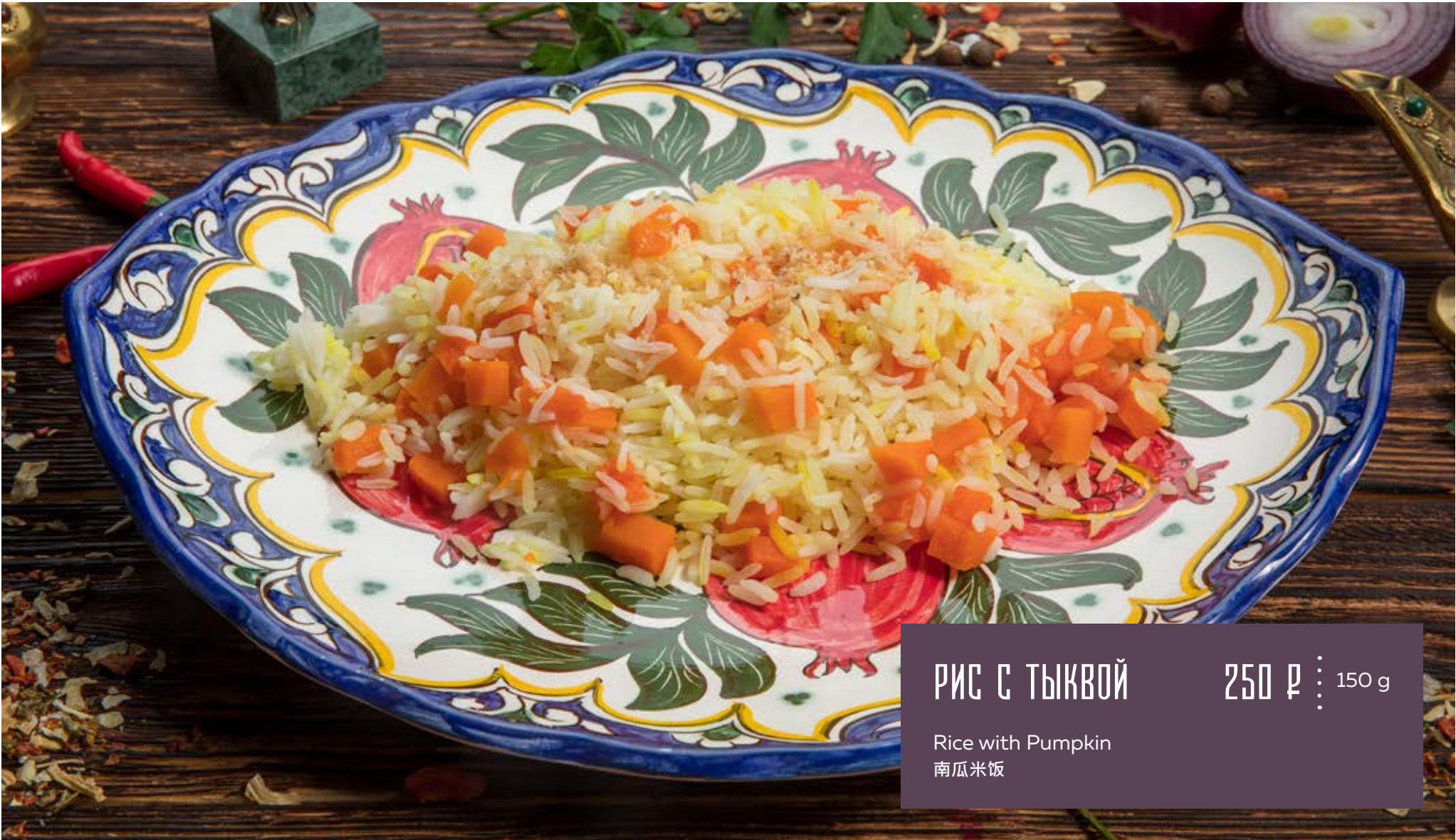
РИС С ТЫКВОЙ 250 р 150 g